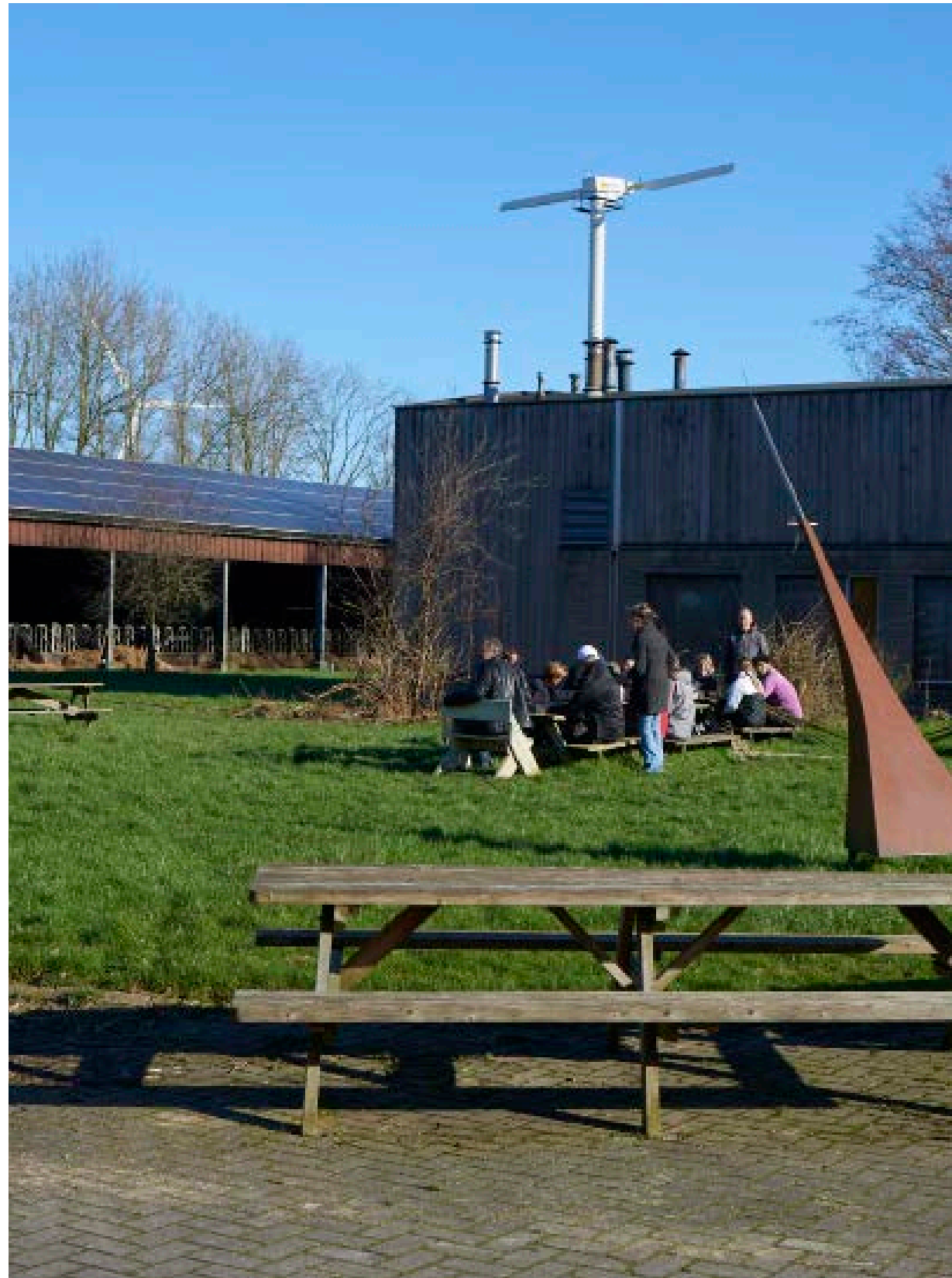
Piet van Ijendoorns Zonnehoeve Een boerenerf waar twintig mensen een goed belegde biologische boterham verdienen.