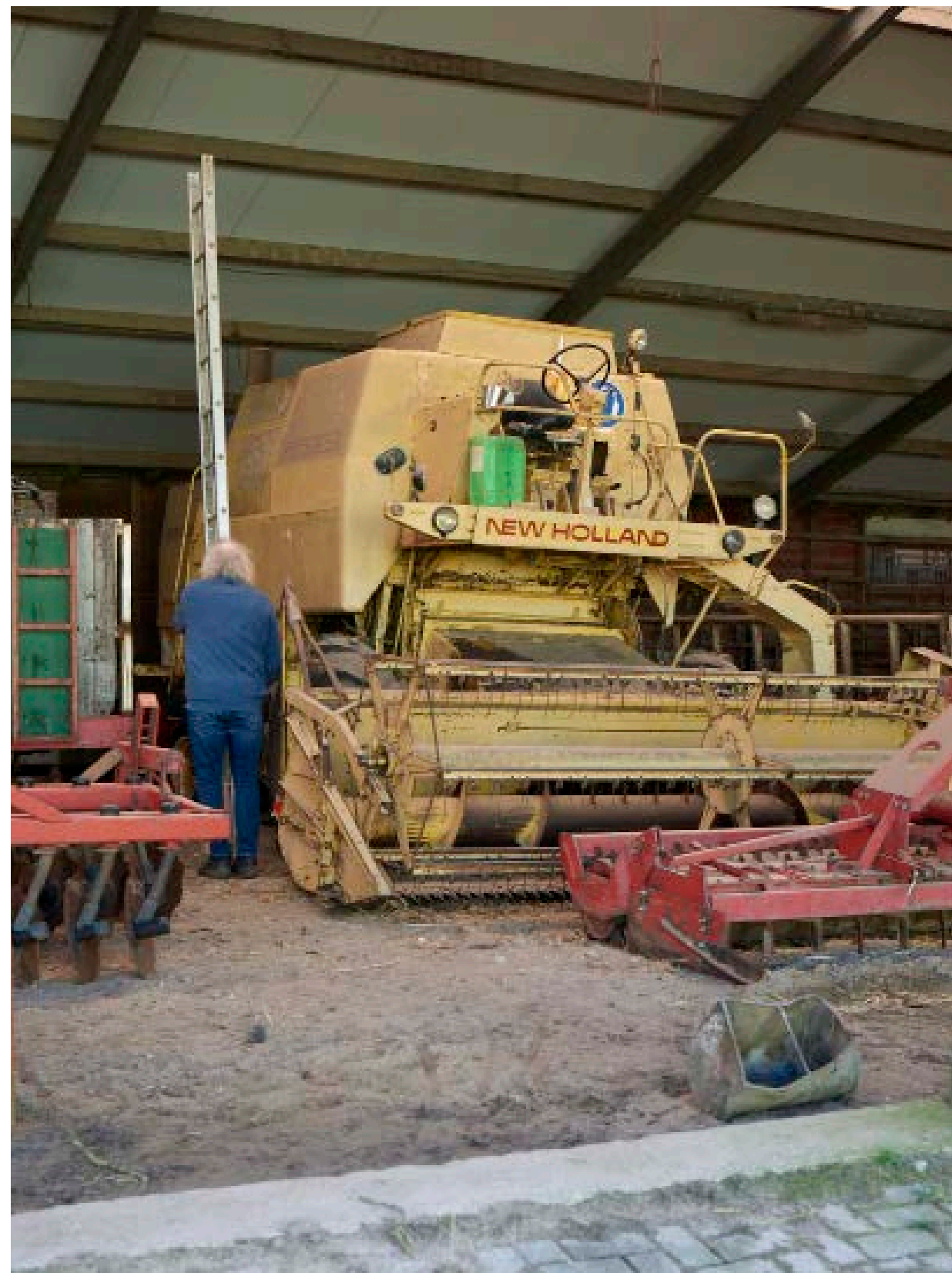
Landbouwgrond als natuur De landbouw als basis van het leven, dat is waar het volgens Van IJzendoorn om draait.